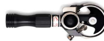
MODEL 90DC Uitvoering Mes Ø 90 mm C-blade \ /

90C kritisch vet trimmen technische delen (vrk) 90C natrimmen runderspierstukken 90C zalmbewerkingen rooklaag / buikvet vers