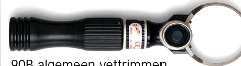
MODEL 90 Uitvoeringen Mes Ø 90 mm B-blade ( ) C-blade \ /

90B algemeen vettrimmen 90B koud/hard vettrimmen 90B middenrif uithalenvarken 90B natrimmen reuzelresten 90C kritisch trimmen varkensribben 90C natrimmen hammen