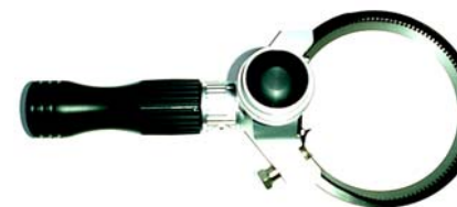
MODEL 128 Uitvoering Mes Ø 128 mm C-blade \ /

128C warm ontvetten runderkarkassen (inwendig/uitwendig) 128C natrimmen bloedvlees/koud ontvetten algemeen 128C technische varkensdelen en runderdelen