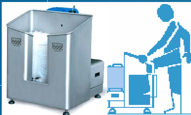
# 27083 robuust RVS uitgevoerde laarzenwas-automaat met 3 borstelsecties. Het ontwerp is bedoeld voor een efficiënte reiniging in korte tijd van zool en laarsschacht.