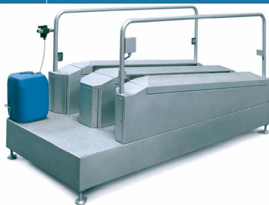
# 12480 station bedoeld als permanent doorloopstation, aanwezigheid wordt geregistreerd d.m.v. foto-cel detectie. Het station is een 2-richtingen wasstation en tevens uit te voeren met ingangs-controlevoorziening met hand-desinfectie.