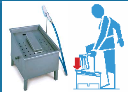
# 3663 Basismodel Laarzenreiniging