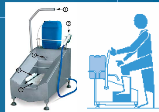
# 29748 Universeel inzetbaar Laarzenwas-station Keuze: alleen zolen óf de complete laars