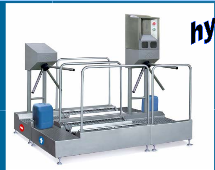
MHS-3 Combinatiestation In-Uit