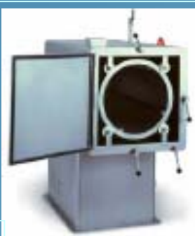
Stokken-wasmachine (max. L 1.200mm) ook meatbrackets