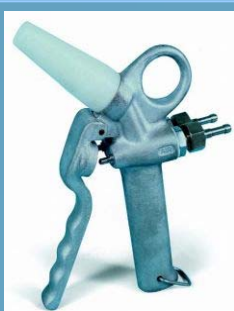
Sproeier Zolenreiniging perslucht + water