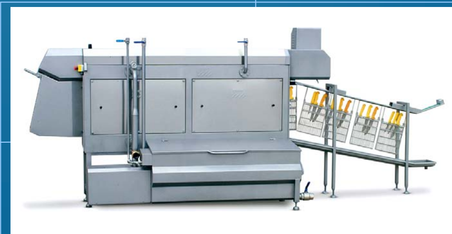
Doorloopwasstation messenrekken 15-30/min * Geschikt voor ROSER messenrekken